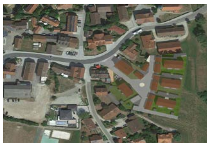
Geplante Bebauung - Lageplan