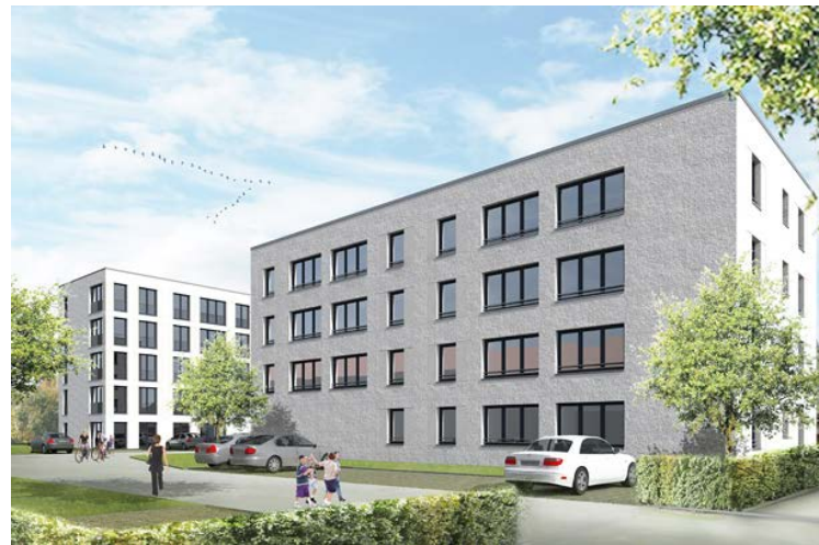
Wohnanlage Münsterblickstraße - Visualisierung